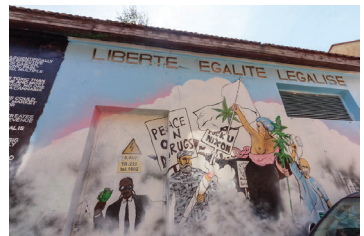
12 MARLA SINGER Užupio 2A