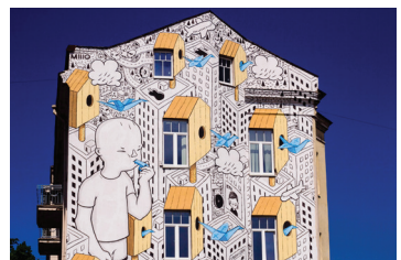
16 MILLO Pylimo 56