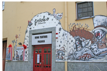
11 ANTANAS DUBRA Šv. Ignoto 4