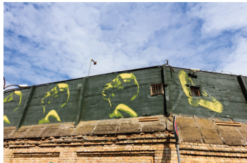
5 TANK PETROL Kražių 7