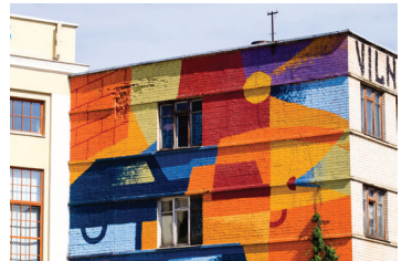
8 ASYLUM Rinktinės 2