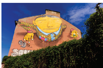
17 OS GEMEOS Pylimo 60