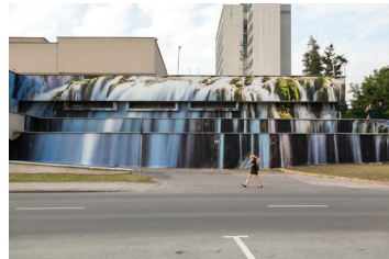
7 IGNAS LUKAUSKAS A. Juozapavičiaus 7