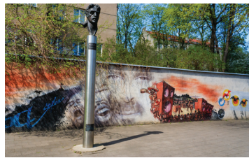
10 K. Kalinausko 3