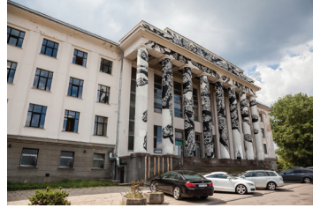
3 M-CITY V. Mykoliaičio-Putino 5