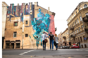
15 SEPE & CHAZME Kauno 1