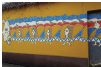
14 AUŠRA BAGOČIŪNAITĖ Arklių 4