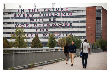
20 MOBSTR Pelesos 1