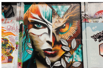
13 AEON Olimpiečių g.