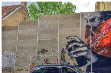
9 JURGIS TARABILDA Odminių 8