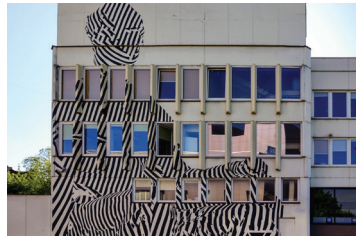
6 ADOMAS ŽUDYS Konstitucijos 23