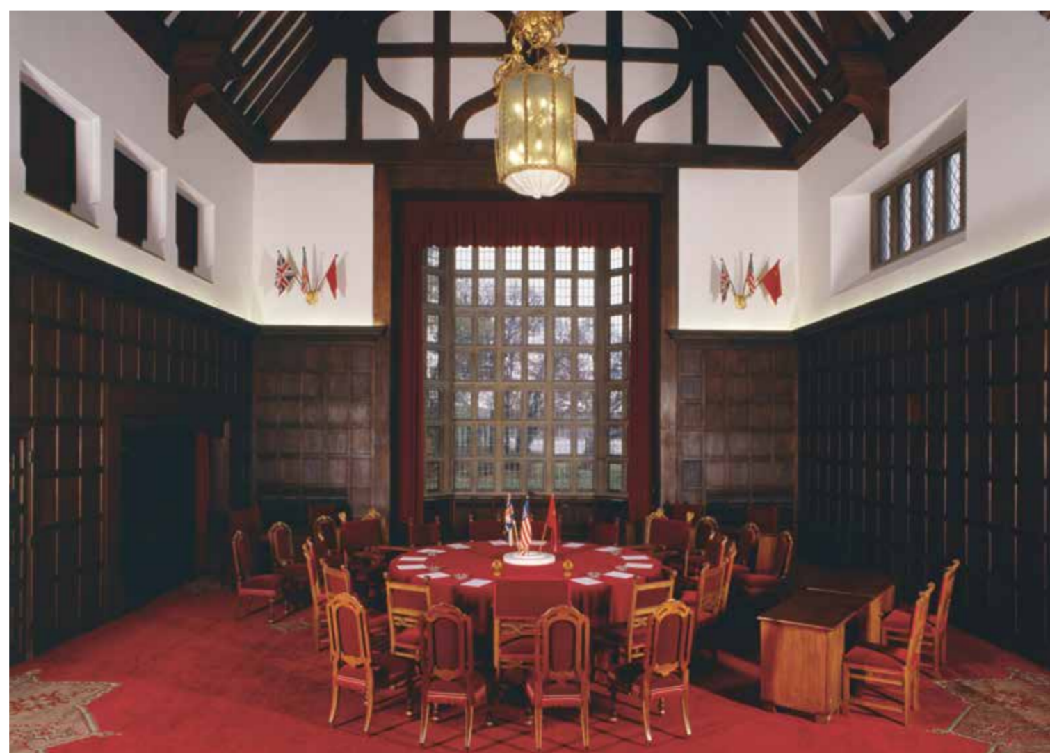
Potsdam, Schloss Cecilienhof, Konferenzsaal Potsdam, Cecilienhof Palace, conference hall