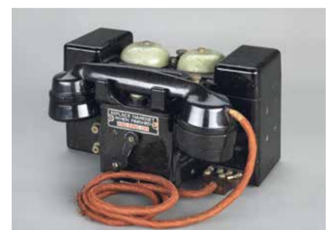
Feldtelefon aus Churchill's Arbeitsraum Field telephone from Churchill's workshop

For the exhibition, the app "SPSG Cecilienhof" will be available for free from the App Store and on Google Play from 4 April 2020.