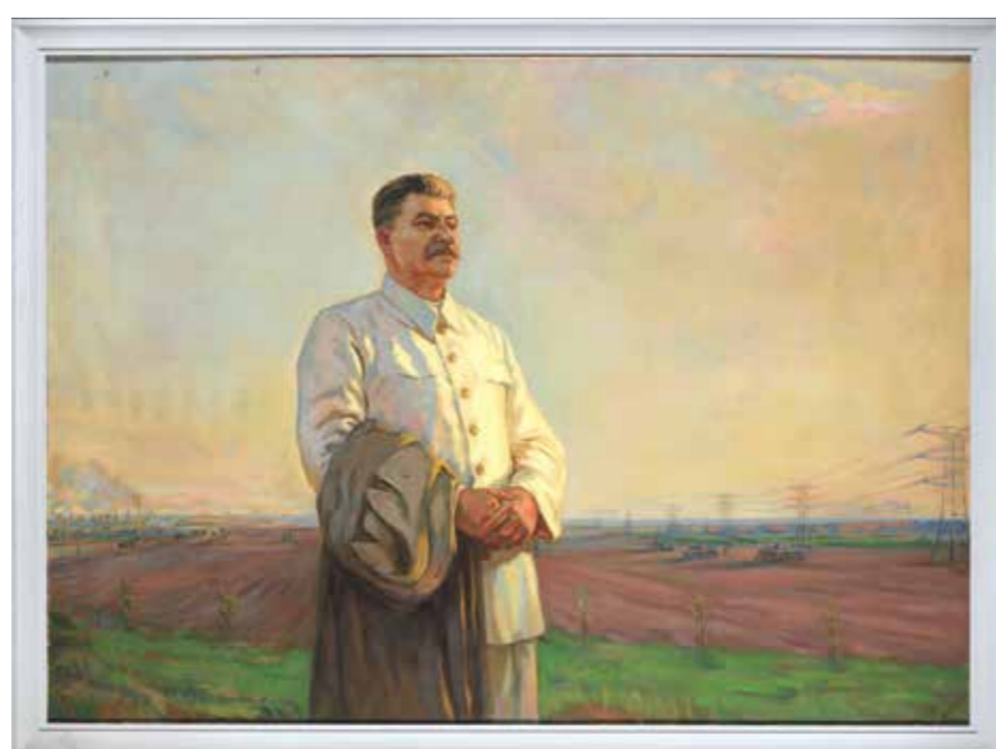
Fyodor S. Shurpin: Der Morgen unseres Vaterlandes, Öl auf Leinwand, 1948 Fyodor S. Shurpin: The Morning of Our Fatherland, Oil on Canvas, 1948