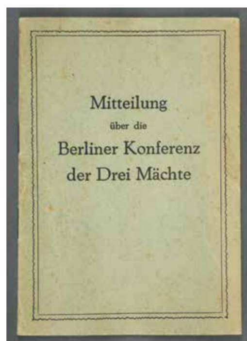
„Mitteilung über die Berliner Konferenz ...“, 1945 Hrsg.: Sowjetische Militärische Administration, Provinz Brandenburg "Report on the Berlin Conference...", 1945 Editor: Soviet Military Administration, Province Brandenburg