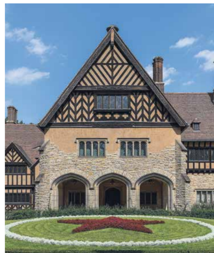
Potsdam, Schloss Cecilienhof, Innenhof mit Sternbeet Potsdam, Cecilienhof Palace, courtyard with star-shaped flower bed